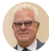
Οδυσσέας Ζώρας Πρόεδρος Ελληνικού Ανοικτού Πανεπιστημίου