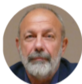
Ζήσης Μαμούρης Πρύτανης Πανεπιστημίου Θεσσαλίας

Την εκδήλωση θα τιμήσουν με την παρουσία τους οι κ.κ.